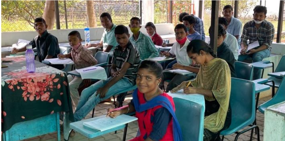
Deels klassikaal beroepsonderwijs jongeren: ook leren lezen en schrijven