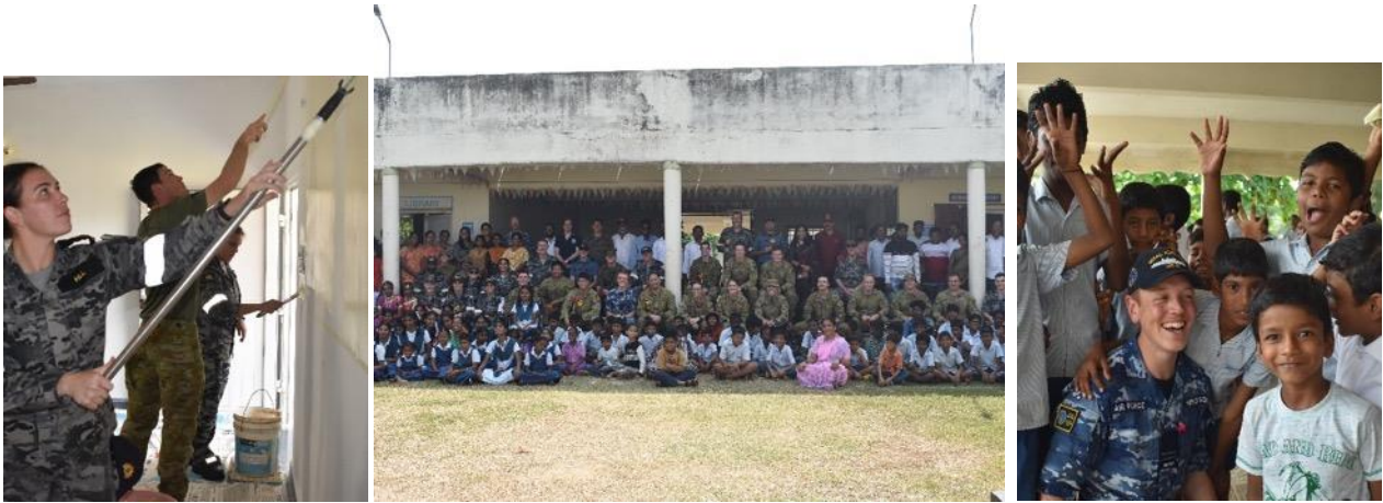
Australian ship HMAS Adelaide crew visited Campus and interacted with children