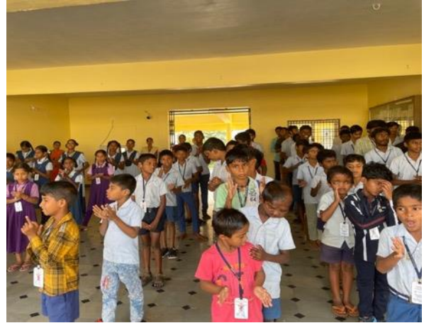
De dagopening in de school: de kleintjes in de hal van de school