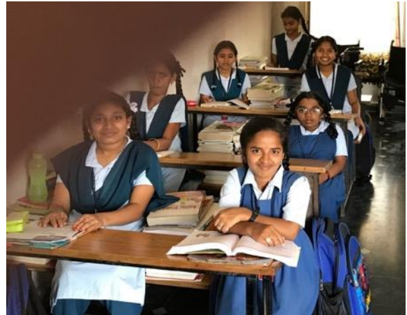
De 10 e klas aan het werk in hun lokaal: stapels examenstof