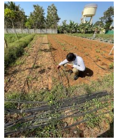
Zaaien en stekken, organisch geteelde tomaten en de drip irrigatie op het Watertankland