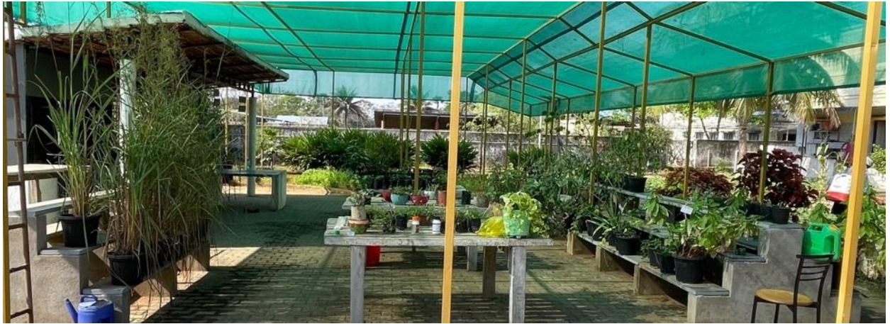
Nieuw: in de kas nu ook (medicinale) planten!