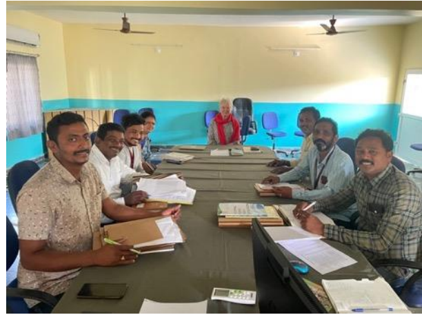
FI vergadert met team beroepsonderwijs