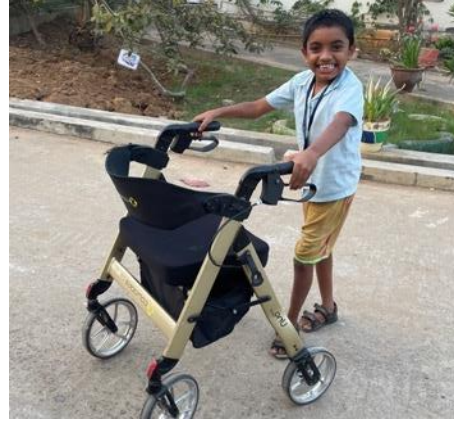
Leerlingen klas 1 – 10 Op weg naar school