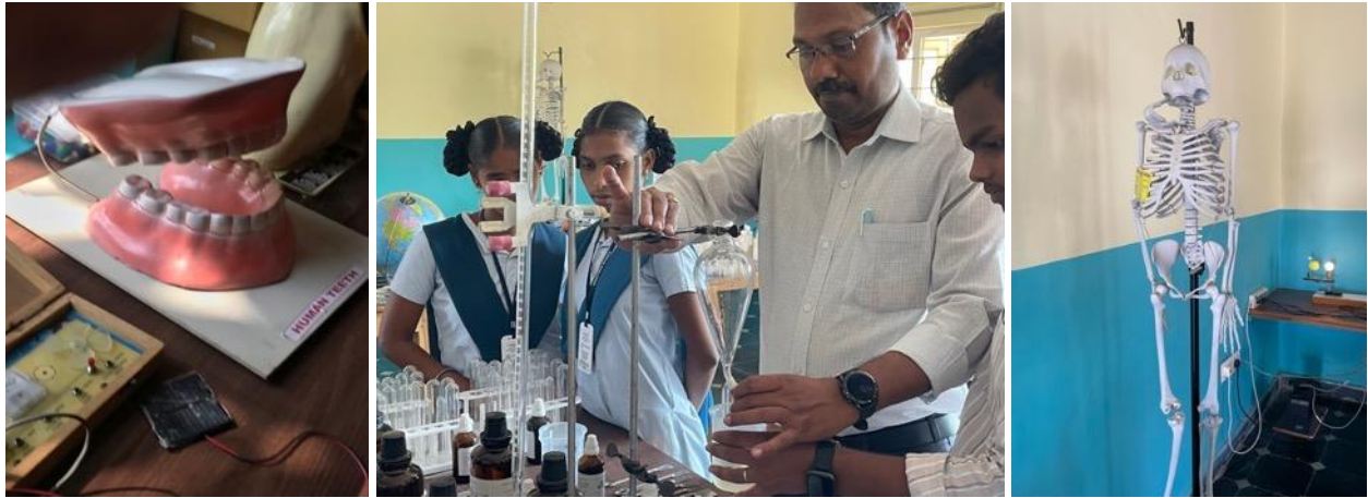
Het science lab is er!