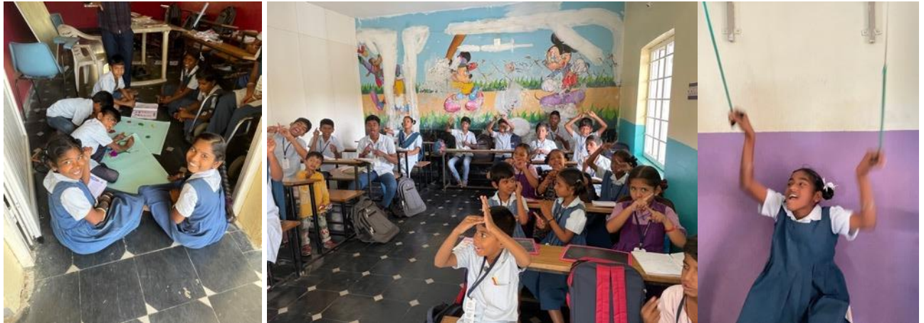
Tekenen, gebarentaal les, bij de fysio