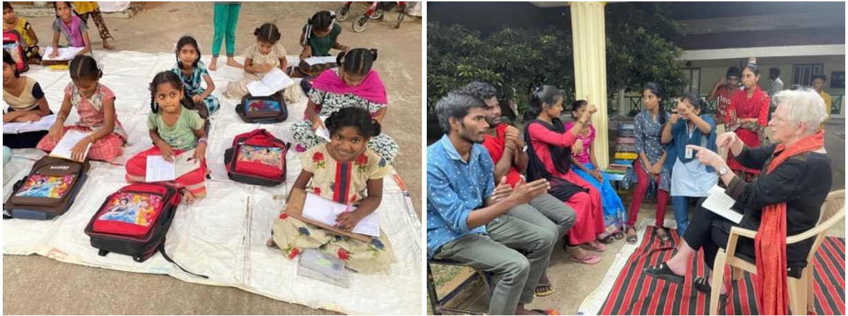
Huiswerk maken bij de kleintjes en overleg met de doofstomme jongeren over hun toekomst