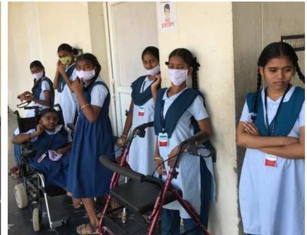
De 9 e en 10 e klassers luisteren vanaf de zijkant