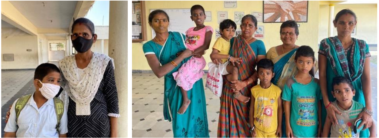
De dagkinderen: in het begin komen hun moeder of oma mee En allemaal lunchen in de dining hall