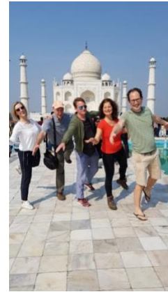
Het AGP SWAP Team februari 2020; hard gewerkt en ook nog even naar de Taj Mahal