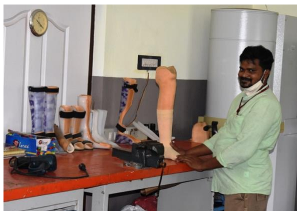
Hard gewerkt op de orthopedische werkplaats: kunstbenen !