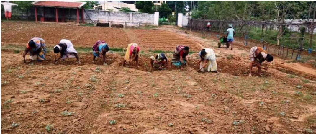
Bijna iedere middag rond een uur of vier: alle moeders tot hun grote genoeg een uurtje in de tuin