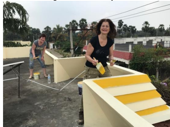
Even pauze en dan weer aan de slag, ook op het dak!