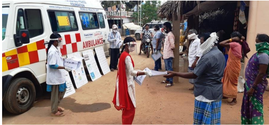
Coronavoorlichting in de dorpen