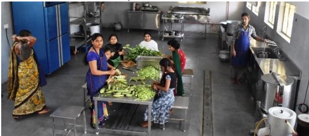
En de nieuwe keuken!