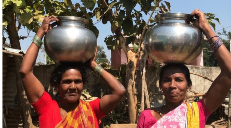
Opening van een van de waterzuiveringsinstallaties in Uddhanam