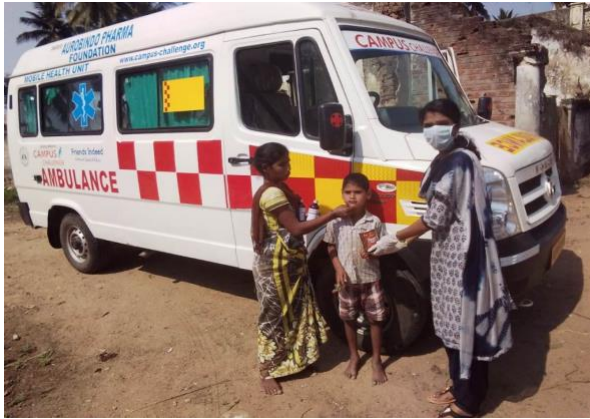
Buitenkinderen op het spreekuur