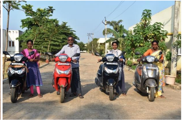
Het duurde even, maar nu durven ze! De sociaal werkers op hun scooters