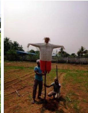
De schijf van 4 van GFF, een van de tuinen en jawel een vogelverschrikker!