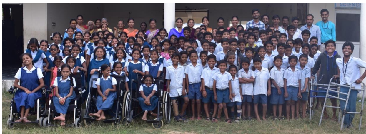
De hele club

In 2019 is de Campus een samenwerkingsverband aangegaan met Youth4Jobs, een organisatie die al jarenlang landelijke ervaring heeft in het plaatsen van jongeren met een beperking. Zij komen naar de Campus, geven daar extra trainingen en cursussen en leggen contacten met bedrijven voor traineeships en echte banen. Door corona zijn deze activiteiten tijdelijk gestaakt.