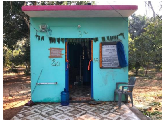
Opening van een waterzuiveringsinstallatie in Uddhanam