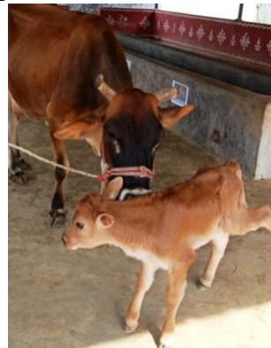
Teveel groente gaat naar de markt, een van de jongeren in opleiding, een kalfje