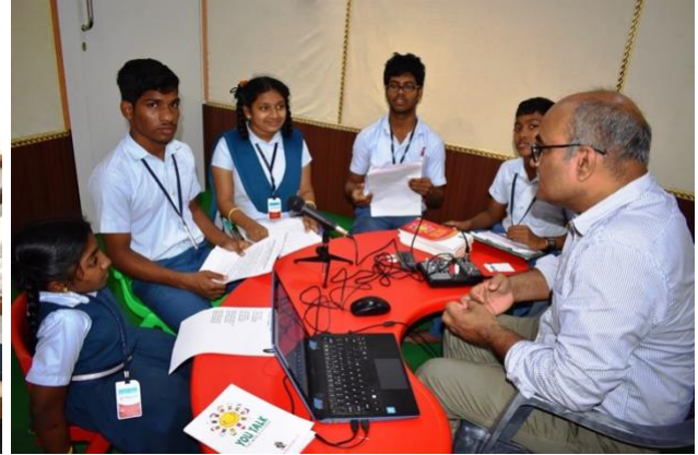
Vorbereiding schoolradio uitzending in 'the guesthouse' en daarna opname