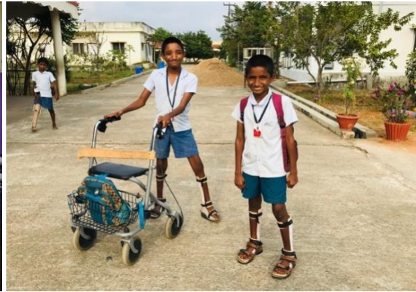
Campuskinderen met orthopedische hulpmiddelen