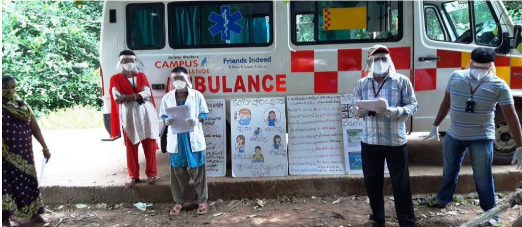
Maart 2020: Corona