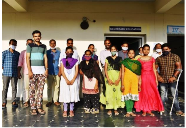
Klaar met de opleiding: naaimachinekrediet De 1e batch voor de secretaresseopleiding