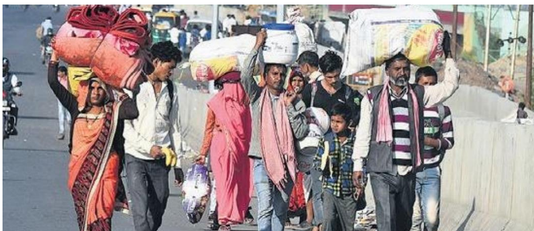
Corona Lockdown: honderdduizenden mensen op weg naar hun geboortedorp