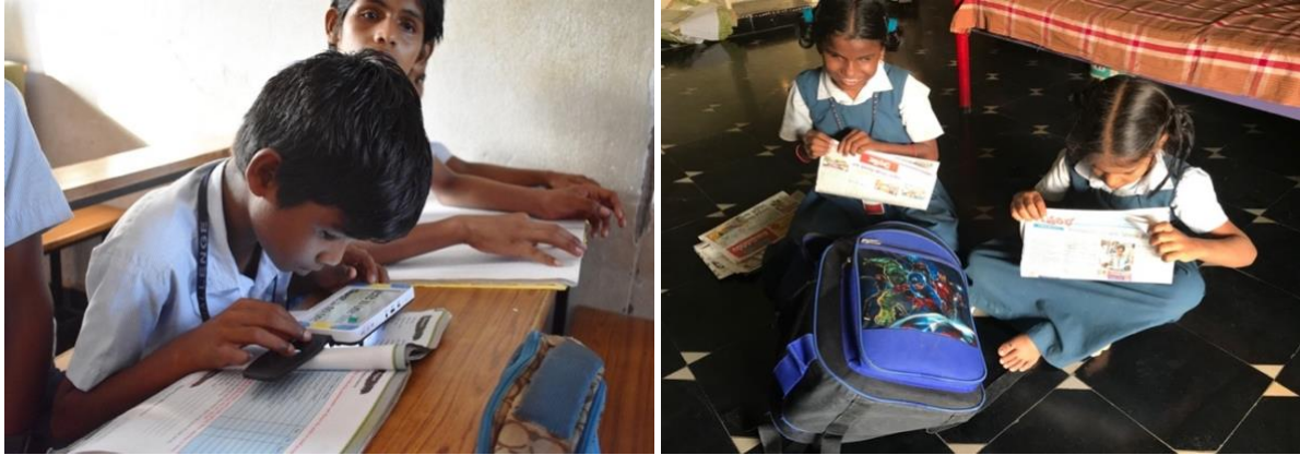
Lezen met een hulpmiddel en kranten knippen voor de braille-oefeningen