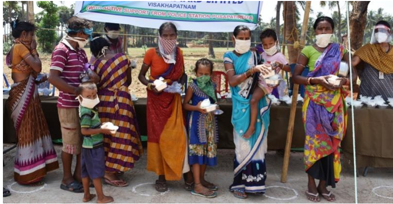
De kraam aan de weg