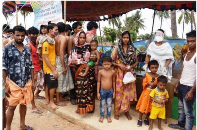
Voedsel, mondkapjes, water, een bemoedigend woord