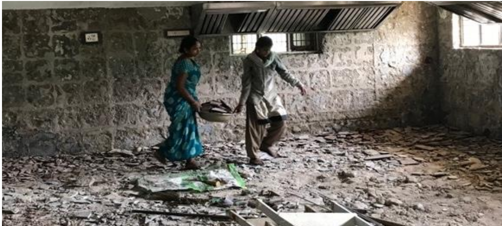
Het slopen van de oude keuken