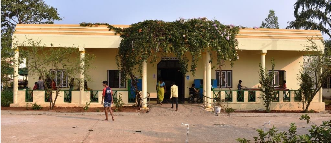
De door AGP/SWAP medewerkers geschilderde eetzaal met daarachter de gerenoveerde keuken