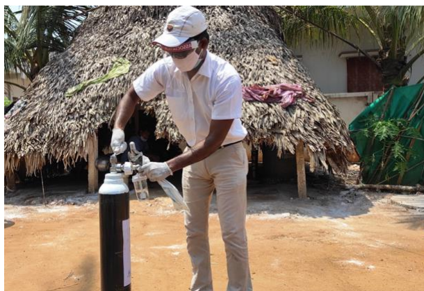
De dokter aan het werk in een vissersdorp