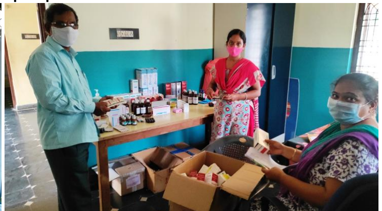
Medicijnpakketten voor de patiënten in thuisisolatie