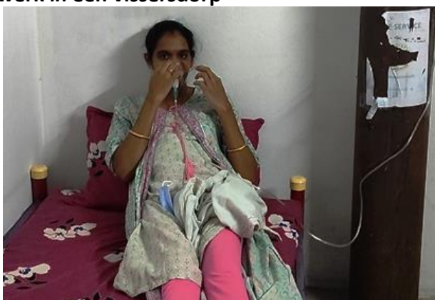
Patiënt aan de zuurstof in een vissersdorp en in het Campus Covid-19 Isolatiecentrum