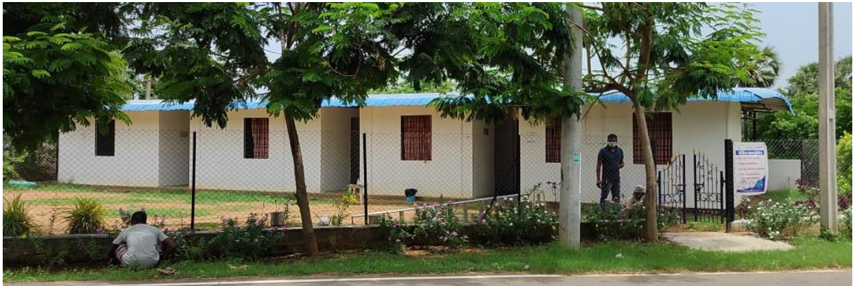
De 'road school' van Campus Challenge; nu Covid isolation center