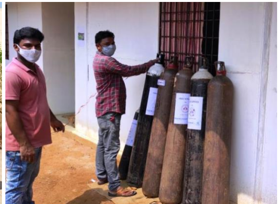
Al tien cilinders!