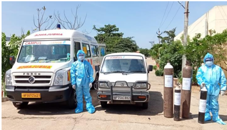
De ambulance en de mini-van gaan op stap