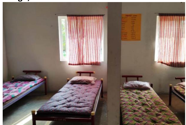
De bedden van de kinderen uit het Kinderdorp worden naar de 'road school' gebracht.