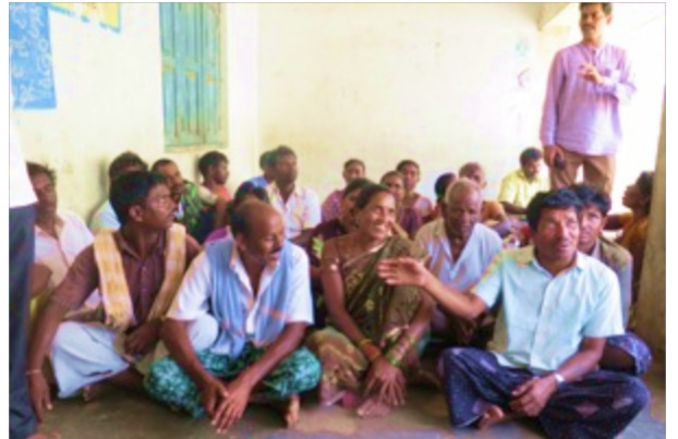
Alleenstaande moeder met kinderen en een vergadering in het dorp