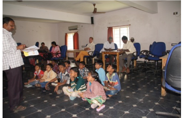
leerkrachtentraining met 'oefenkinderen'