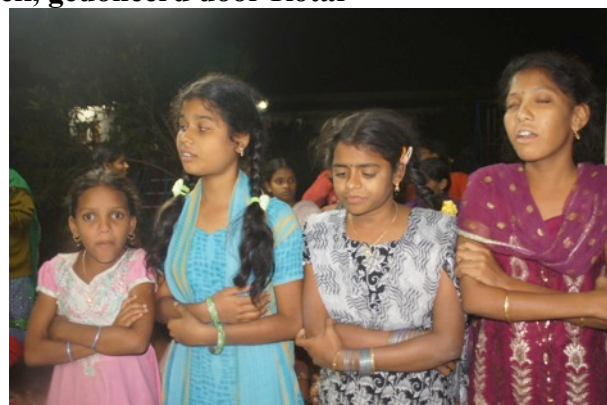
Een zaterdagavond: toneel!