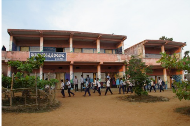
een STAR school in wording