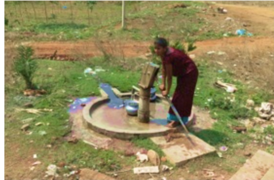
Waterputten in de dorpen