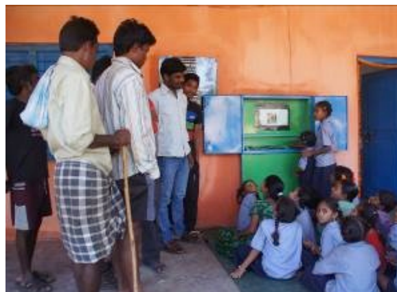
Kinderen en hun ouders: I Learn to Speak English!