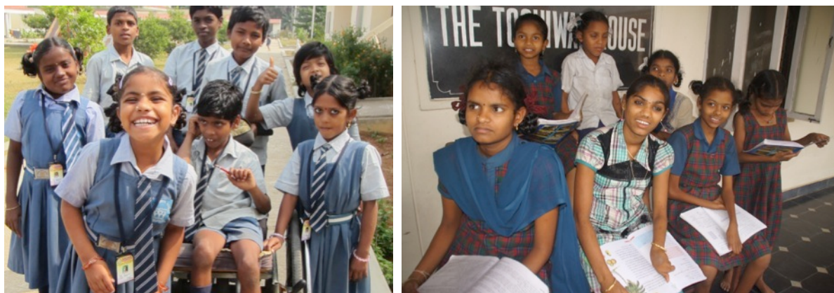
de kinderen op de Campus