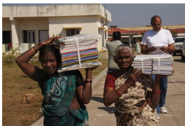
Boeken voor de bibliotheek, gedoneerd door Rotar