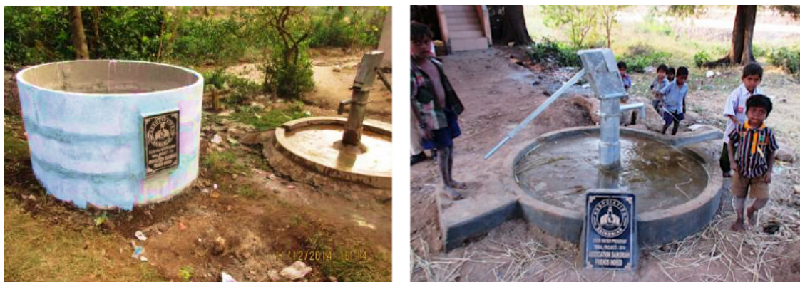
Een vulnisbak en een nieuwe waterput