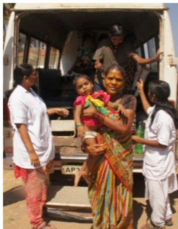
naar de fysio op de Campus