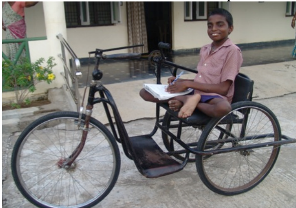
op de driewieler