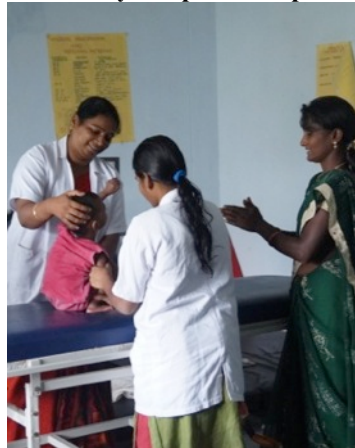
Bij de fysio