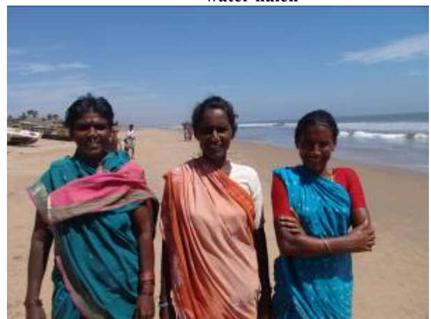
de moeders op het strand