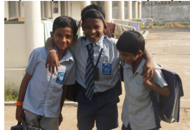
Op de campus, op weg naar school