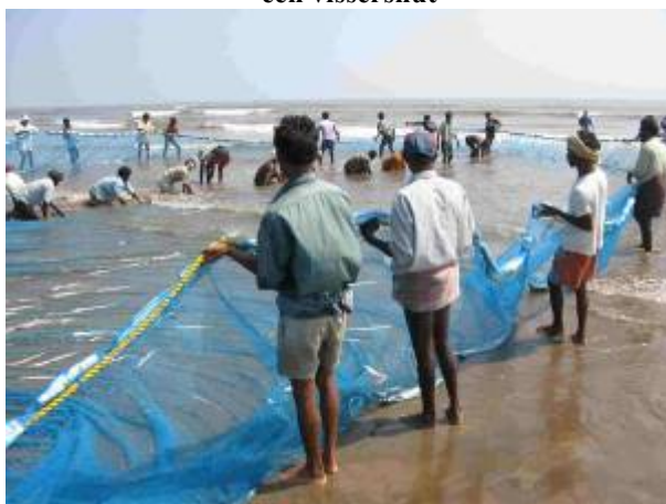
vaders halen de vis binnen