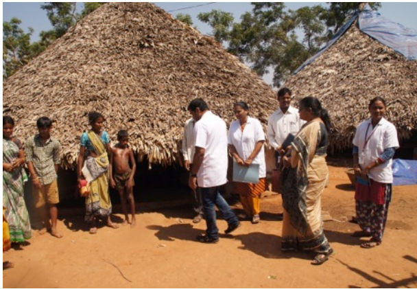
Het ambulante team in een vissersdorp