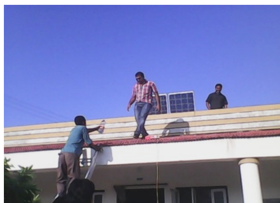
Tijdelijk stroom: de zonnepanelen van het ILSE programma gaan op de daken van de kinderruizen