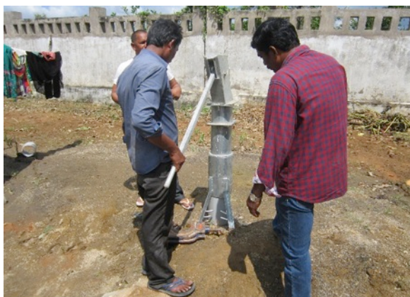
Water: er wordt bij de kinderruizen een handpomp geslagen

In de kinderruizen en de gastenverblijven stond 20 cm water. Bij het lager gelegen medisch centrum stond 80 cm water. Het grootste probleem was dat er geen elektriciteit was en daardoor dus ook geen water. te wassen haalden de moeders emmers water van het ondergelopen veld af. En voor drinkwater kon er gelukkig heel snel een handpomp worden geregeld.